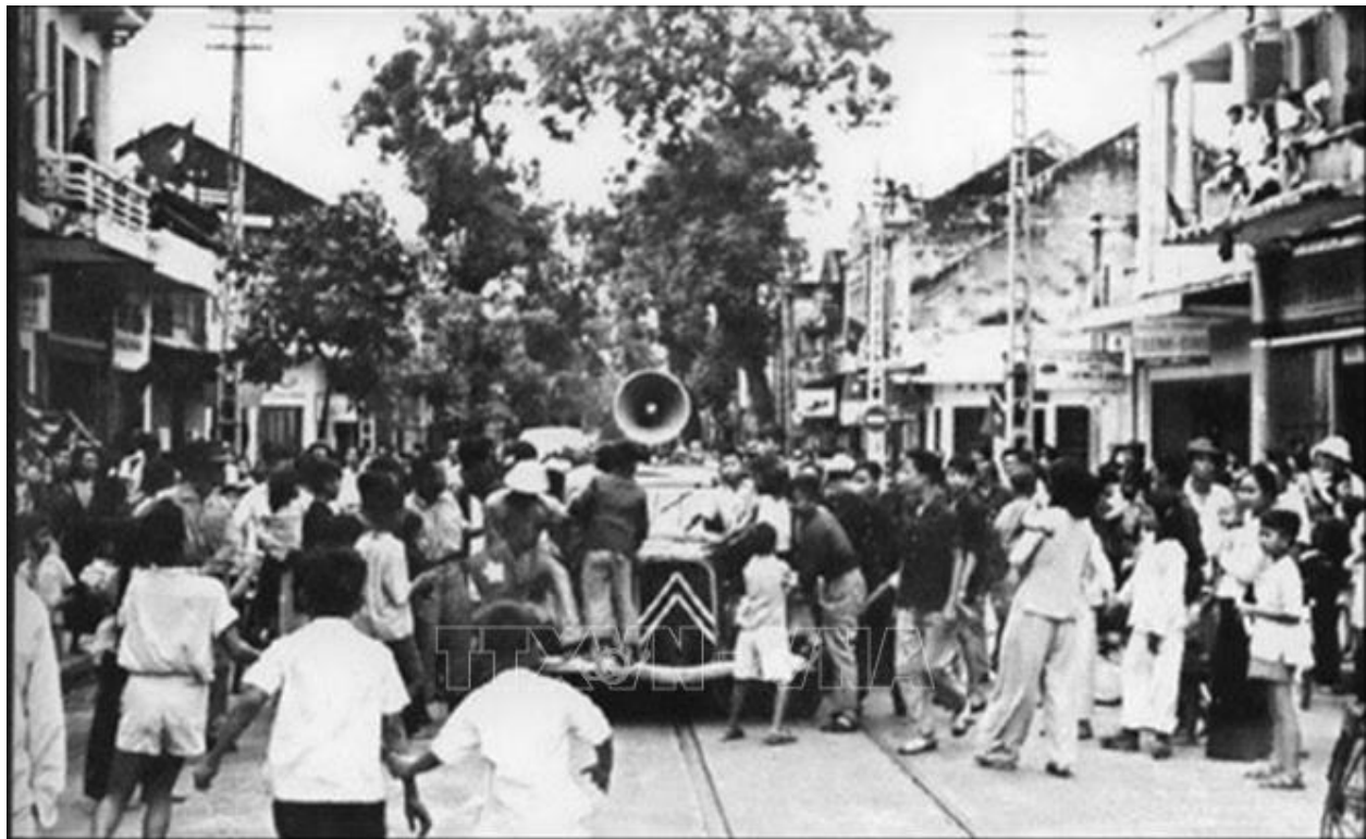
Phát lệnh toàn quốc kháng chiến ở Hà Nội, tháng 12/1946.

Ra đời trong thời khắc lịch sử đặc biệt, “Lời kêu gọi toàn quốc kháng chiến” của Chủ tịch Hồ Chí Minh đã tác động đến sâu thẳm lòng yêu nước và ý chí quyết cường của dân tộc, trở thành biểu tượng lớn của sức mạnh đại đoàn kết.